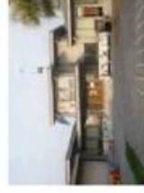
Scuola dell'infanzia MARCO POLO