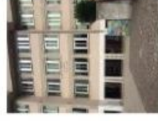
Scuola Primaria V. da Feltrre Scuola Primaria A. Arnaldi Scuola Primaria A. Loschi