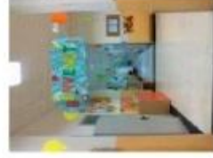
Scuola dell'infanzia BURCI